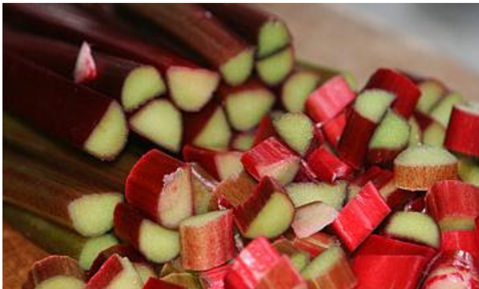
Lækker anretning af rabarber soufflé med vaniljecreme.

møder frem næste gang og kan være med til at diskutere løsninger for rum 2.